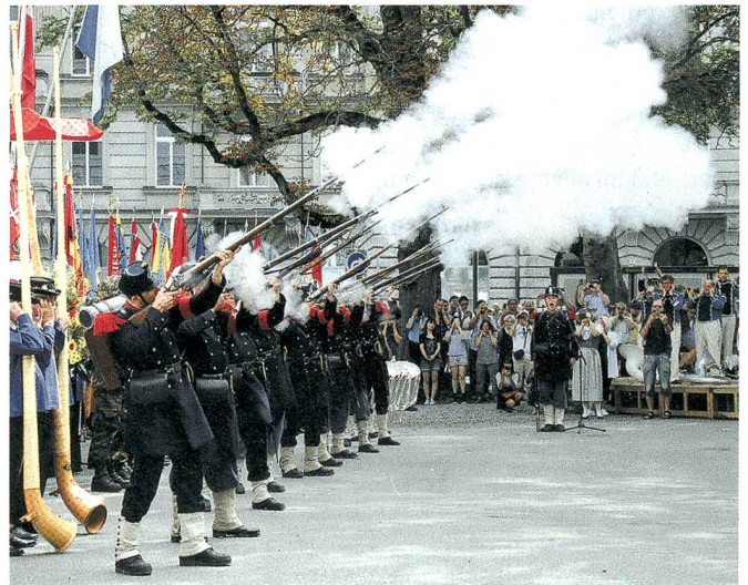
Der Ehrensalue der Compagnie 1861 eröffnet den Festakt.