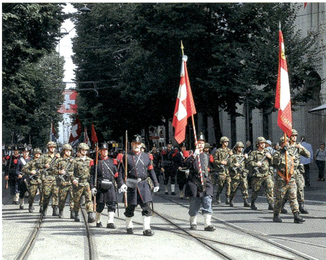
Der KUOV-Fahnenzug und die Compagnie 1861 beim Einmarsch.