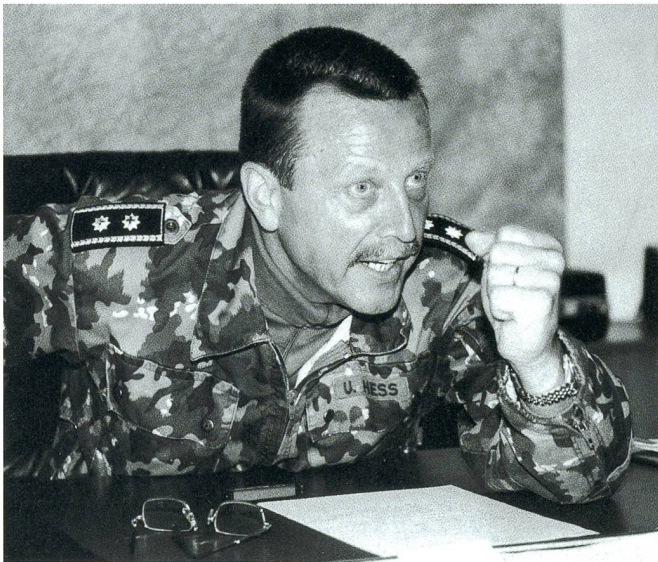
Als Kdt F Div 6: «Ich will...!»