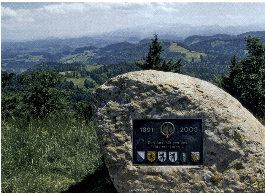
Auf dem Hörnli erinnert ein würdiger Gedenkstein an das Feldarmeeekorps 4.

Jedes Jahr um Mitte Juni darf der «Hörnli»-Wirt eine stattliche Schar von Kameraden aus dem Stab FAK 4 begrüßen und bewirten. Die ganz Junggebliebenen wäh-