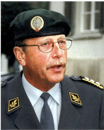
Auch als KKdt mit grünem Inf Beret.