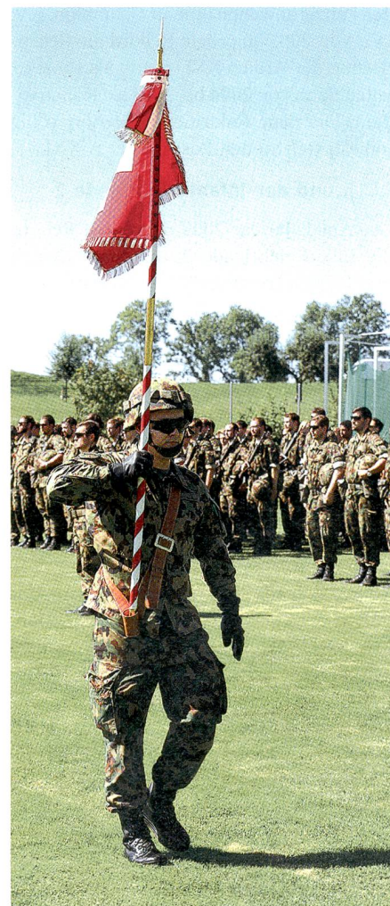
Das Feldzeichen der L Flab Lwf Abt 7.