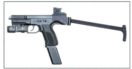
B&T USW – Waffe zugeschnitten auf die aktuelle Bedrohungslage.

Die halbautomatische Waffe im Kaliber 9mm Para soll bei äusserst kompakten Ausmassen – sie fällt kaum grösser als eine Dienstpistole aus – sichere Treffer auch auf grössere Distanzen und auch in Stresssituationen bieten. Das in der Schweiz designte und hergestellte System USW besteht aus der Waffe selbst, einer integrierten seitlich anklappbaren Schulterstütze und dem brandneuen Rotpunktvisier «Nano» aus dem