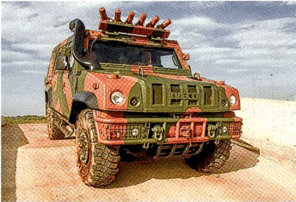
Iveco LMV für die Streitkräfte Brasiliens.

In einem ersten Vertrag soll die Lieferung von zunächst 32 Fahrzeugen vereinbart werden. Weitere 122 LMV sollen dann