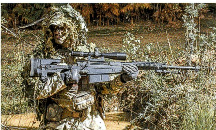
Dänemark beschafft die neue Präzisionsbüchse AX50 von Accuracy International.

Die dänischen Streitkräfte beschaffen die Präzisionsbüchse AX50 aus dem Hause Accuracy International als neues Scharfschützengewehr grosse Reichweite. Wie das britische Unternehmen mitteilte, hat die dani-