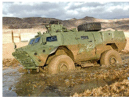
TAPV mit zwei Jahren Verspätung.

Seit 2012 läuft die Entwicklung unter Federführung von Textron Systems. Die kanadische Rheinmetall-Tochter ist an dem 415-Millionen-Euro-Programm mit etwa einem Viertel beteiligt. Hier finden Endmontage und die Auslieferung statt. Dazu kommen die Integration der ferngesteuerten Waffenanlage von Kongsberg, der Navi-