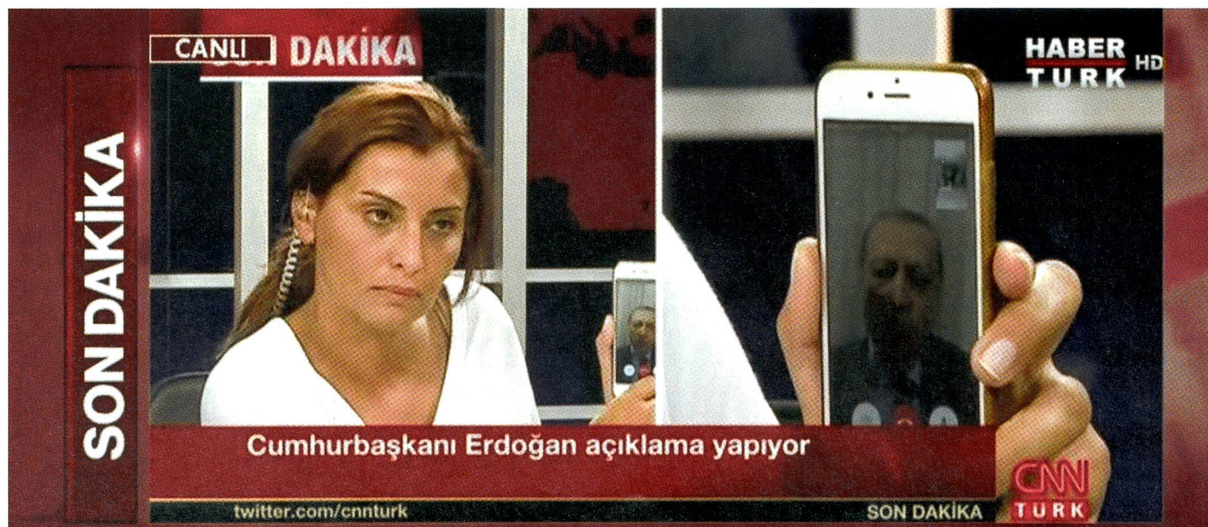
16. Juli 2016, 0.27 Uhr: Die CNN-Moderatorin hält mit Ton das Bild in die Kamera, das ihr Erdogan von Marmaris zuspielt.