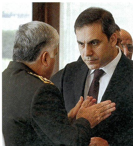
Der MIT-Geheimdienst-Chef Hakan Fidan berät sich mit einem Heeres-General.