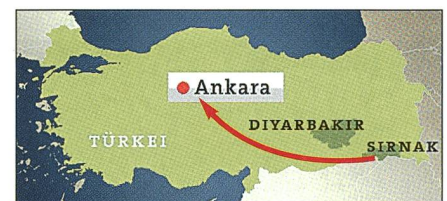
Die geplante C-130-Route für die Putsch-Flüge nach Ankara – elend gescheitert.