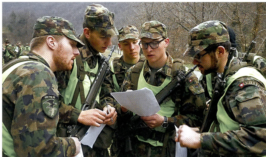
Zwölf Augen sind auf das neue Dokument gerichtet. Jeder bildet sich seine Meinung.