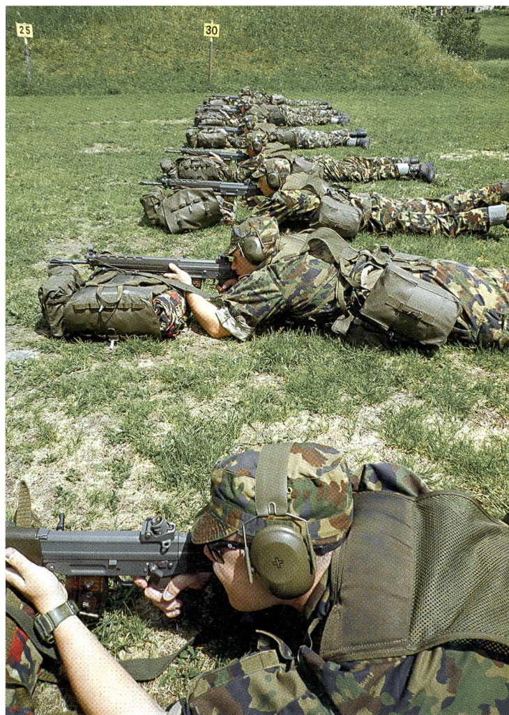
...wie die Gefechtsschiessausbildung für die Log UOS 42.

Anwendung können das Durchsetzungsvermögen und Verantwortungsbewusstsein trainiert werden.