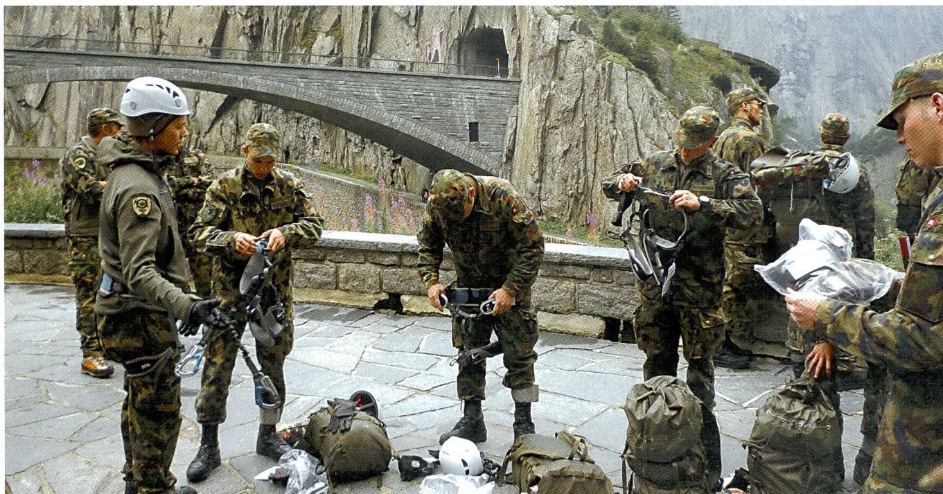
Übungen führen immer wieder zu Orten der Schweizer Geschichte: Hier die Teufelsbrücke am Russendenkmal.

Jede Woche findet eine mehrtägige Führungsübung im Gelände statt, in der militärische Führungsprozesse und -tätigkeiten praktisch trainiert werden. Jede Füh-