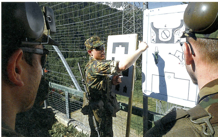
Gute Visualisierung gehört in den anspruchsvollen Schulen von Airolo zum Handwerk.

rungssequenz wird von den Klassenlehrern besprochen und bewertet. Dann erfolgt ein Chefwechsel, um möglichst vielen Anwärtern die Gelegenheit zu geben, das Erlernte im Massstab 1:1 umzusetzen. Zugleich vermitteln die Führungssituationen wertvolle praktische Erfahrungen, die auf der vorgängig vermittelten Theorie aufbauen.