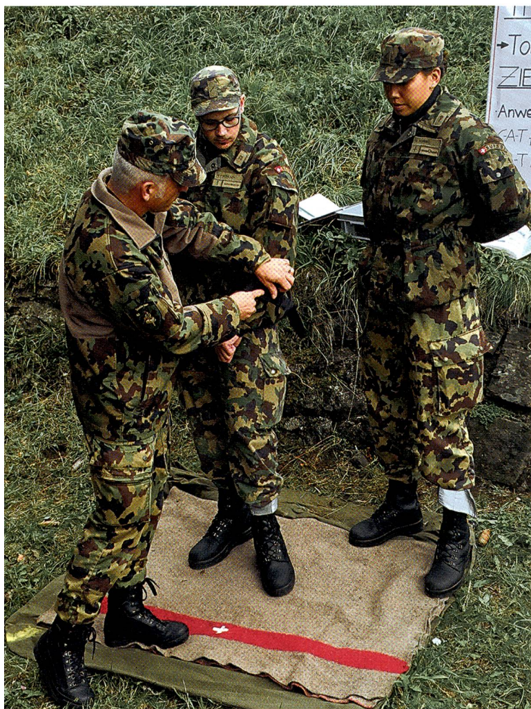
Die Sanitätsausbildung will in den Schulen von Airolo gelernt sein...