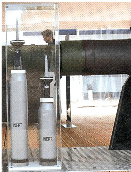
Der Grössenvergleich: Pfeilpatrone 130 mm (links) gegen Pfeilpatrone 120 mm.