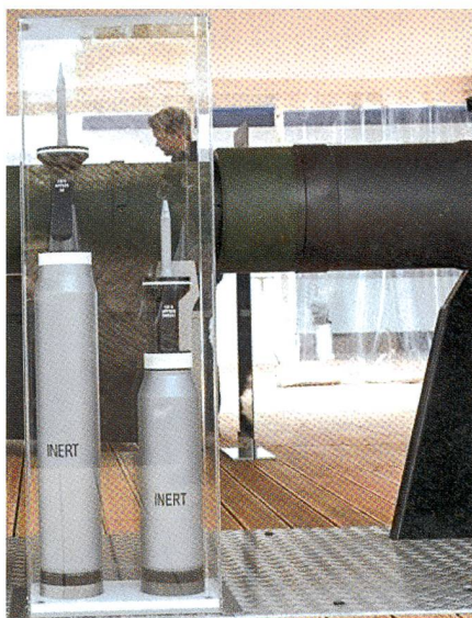
Der Grössenvergleich: Pfeilpatrone 130 mm (links) gegen Pfeilpatrone 120 mm.