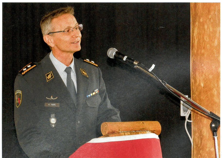
Divisionär Roland Favre, Kommandant der Ter Reg 1, bei der Begrüssung.

Insbesondere wenn es darum geht, Krisensituationen wie die im Kanton Bern in der Vergangenheit häufig aufgetretenen Hochwasser oder anstehende Herausforderungen wie den Flüchtlingsansturm im Sommer 2016 mit entsprechenden Lö-