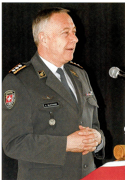
Der Chef der Armee vermittelt Wirtschaftsvertretern den Mehrwert einer militärischen Kaderausbildung.

sungsvarianten zu meistern, finden die Kantone in der Armee einen leistungsfähigen und produktiven Ansprechpartner.