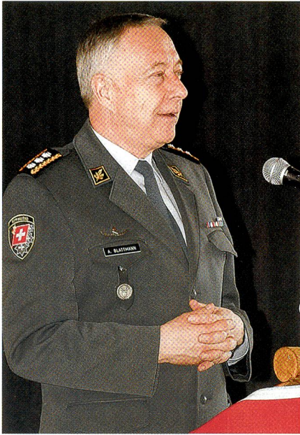
Der Chef der Armee vermittelt Wirtschaftsvertretern den Mehrwert einer militärischen Kaderausbildung.

sungsvarianten zu meistern, finden die Kantone in der Armee einen leistungsfähigen und produktiven Ansprechpartner.