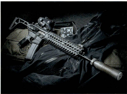
Fertigung des neuen SIG-Sturmgewehrs MCX in Deutschland.

Die 2013 erstmals vorgestellte Waffe lässt sich durch den Anwender individuell für den Einsatz konfigurieren. So stehen derzeit drei verschiedene Kaliber (5,56 × 45 mm, .300 BLK/7,62 × 35 mm und 7,62 × 39 mm) und jeweils drei unterschiedliche Rohrlängen zur Verfügung. Obwohl das SIG MCX äusserlich und auch hinsichtlich