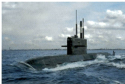
Das Angriffs-U-Boot «Amur-1650».

Die marokkanische Marine plant, eine U-Boot-Flotte aufzubauen. Marokko hat mit Russland im März 2016 einen «strategischen Pakt» geschlossen, der u.a. die Lieferung eines modernen, diesel-elektrischen U-Bootes vom Typ «Amur-1650», eine Ex-