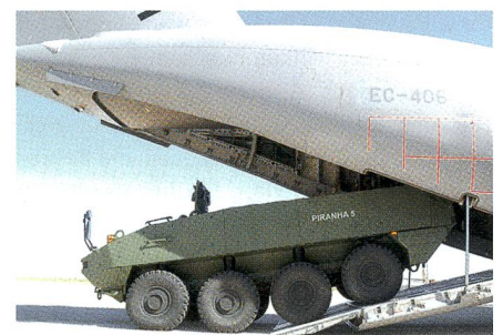
Verlad eines Piranha V in eine A400M.

Im Rahmen dieses Testverfahrens wurde der PIRANHA 5 vollständig in den Frachtraum gefahren und entsprechend den Lufttransportbestimmungen fixiert. Die Besatzung war problemlos in der Lage, das Fahrzeug in den Airbus A400M zu verladen. Der Frachtraum bietet Platz für einen PIRANHA 5 und 29 vollständig ausgerüstete Soldaten. Das Ziel war, den Verlad eines PIRANHA 5 in den Frachtraum ohne spezielle Vorbereitungen als Teil eines