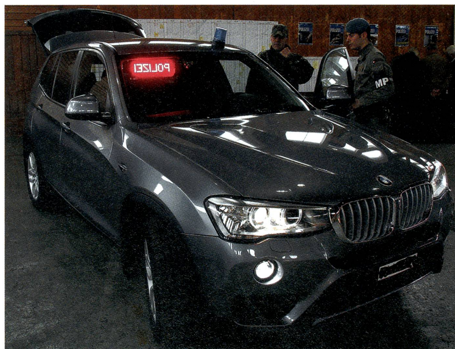
Die Militärpolizei ist auch mit Zivilfahrzeugen ausgerüstet, hier ein BMW.

Der Milizteil Mil Sich gliedert sich aktuell in die MP-Bataillone 1 bis 3, das Schutzdetachment Bundesrat SDBR und das Sicherheitsdetachment Militärpolizei SDMP.