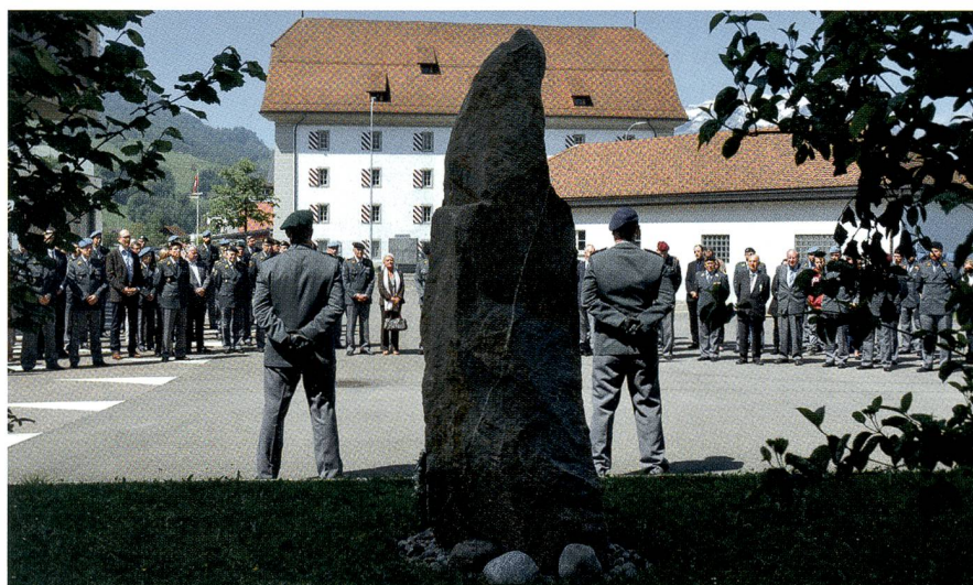
Die würdige Feier in der Kaserne Wil-Oberdorf NW bei «Kaiserwetter».