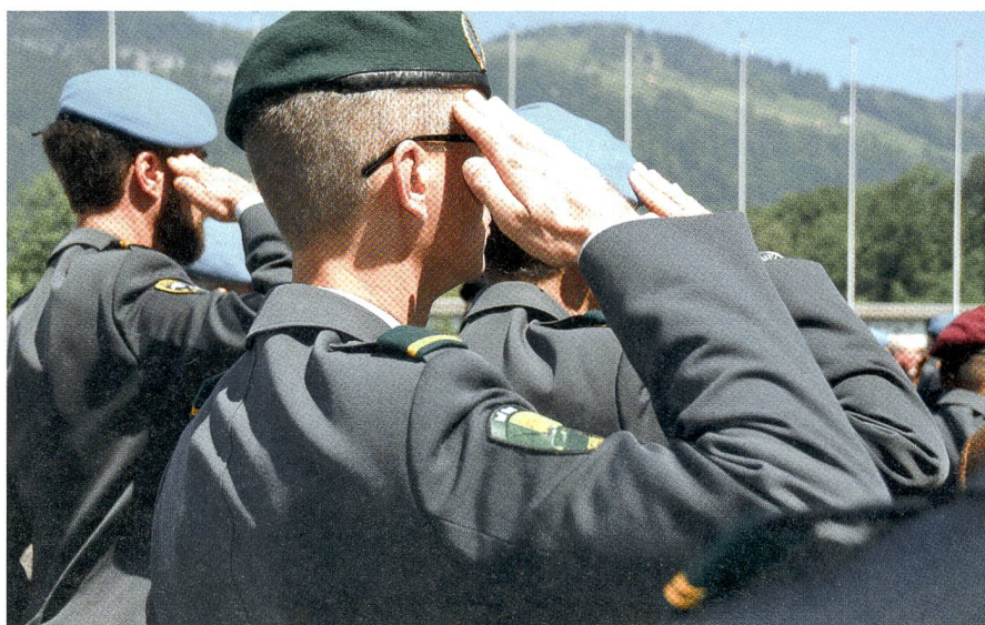
«Ich hatt' einen Kameraden» und die Nationalhymne: Gruss mit Handanlegen.