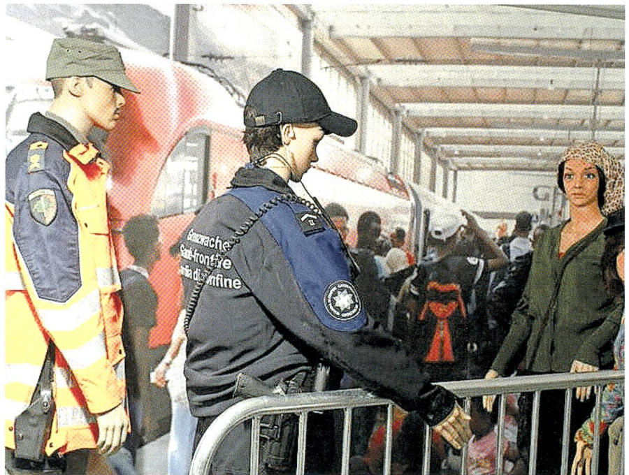
Das Szenarium im Museum im Zeughaus zeigt eine Grenzkontrolle im Bahnhof.

Oft ist nicht erkennbar, ob sie von Staaten ausgehen. Ihr Ziel ist die Destabilisie-