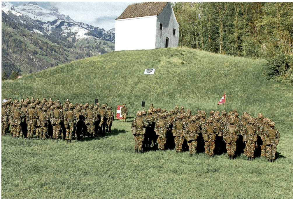
Die Urner Landsgemeindewiese «zu Bötzingen an der Gand bei Schattdorf».