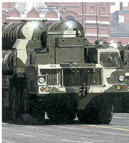
Die S-300 ist ein leistungsfähiges russisches Boden-Luft-Fliegerabwehrsystem.