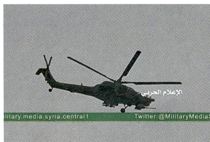
Das erste (unscharfe) Bild eines Russen-Helikopters – ein Mi-28 – über Palmyra.

Der Mi-28 trägt seinen NATO-Code HAVOC (Verwüstung) und seinen russischen Namen Notschnoj Ochochnik (Nacht-