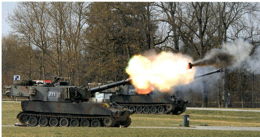
WK der Artillerieabteilung 16 mit Besuchstag: Feuer frei in Frauenfeld – Seiten 16–17.