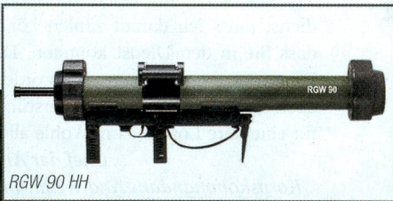
RGW 90 HH