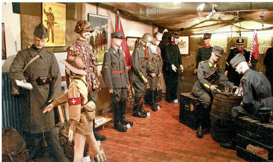
Im Zeughaus Uster: Blick ins Schweizerische Unteroffiziersmuseum.