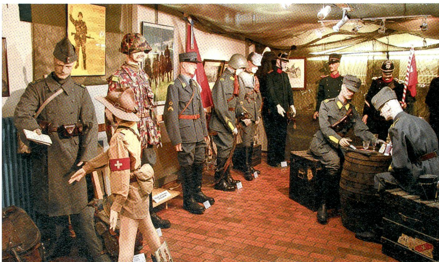
Im Zeughaus Uster: Blick ins Schweizerische Unteroffiziersmuseum.