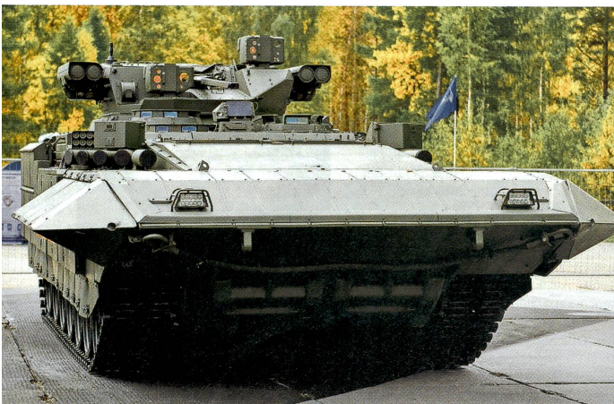
Schwerer Kampfschützenpanzer T-15 Armata an der Russian Arms Expo 2015.

Das unter dem Namen Afghanistan bekannt gewordene Aktivschutzsystem detektiert mit einem leistungsfähigen AESA-Radar ( Active Electronically Scanned Array , Radar mit aktiver elektronischer Strahlenschwenkung), das auch beim neuen russischen Mehrzweckkampfflugzeug Suchoi T-50 zum Einsatz kommt, anfliegende Projektile und bekämpft diese mit Softkill- (Störung der gegnerischen Zielerfassungssysteme mittels künstlichen Nebels und/