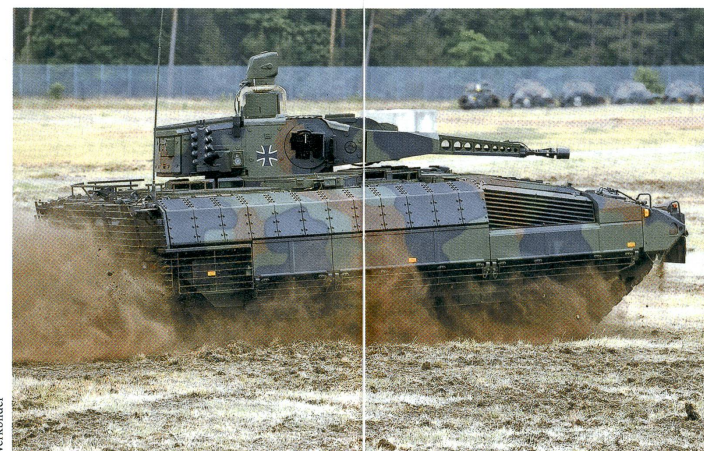
Der Puma, ein Produkt der deutschen Firmen Krauss-Maffei Wegmann und Rheinmetall.