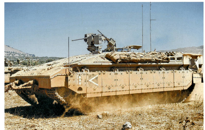
Schwerer Schützenpanzer Namer der IDF (Israel Defense Forces).