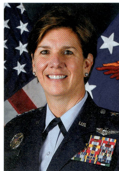
Luftwaffengeneral Lori Robinson, Befehlshaberin des US Northern Command und erster weiblicher Kommandant eines US Combatant Command.

Neben Stabsfunktionen kommandierte sie eine Frühwarn- und Kontroll-Staffel, war Stellvertretende Kommandantin des 405th Air Expeditionary Geschwaders, welches u. a. mit B-1B-Bombern, KC-135-Tankern und E-3-Sentry-Maschinen in den Operationen Enduring Freedom und Iraqi Freedom eingesetzt war. Sie hat zwei Masterdegrees erworben und Studienaufenthalte bei der Brookings Institution und an der Harvard Universität absolviert.