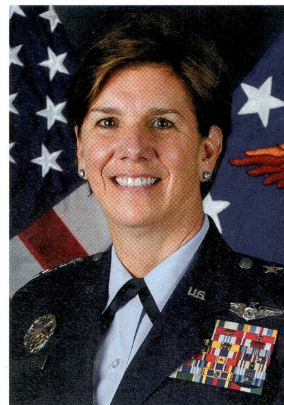
Luftwaffengeneral Lori Robinson, Befehlshaberin des US Northern Command und erster weiblicher Kommandant eines US Combatant Command.

Neben Stabsfunktionen kommandierte sie eine Frühwarn- und Kontroll-Staffel, war Stellvertretende Kommandantin des 405th Air Expeditionary Geschwaders, welches u. a. mit B-1B-Bombern, KC-135-Tankern und E-3-Sentry-Maschinen in den Operationen Enduring Freedom und Iraqi Freedom eingesetzt war. Sie hat zwei Masterdegrees erworben und Studienaufenthalte bei der Brookings Institution und an der Harvard Universität absolviert.