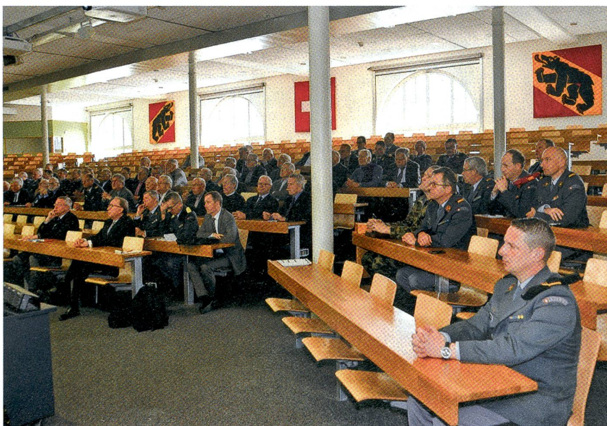
Reges Interesse an der VKB-Generalversammlung in der Berner Mezener Kaserne.

Die Vorlage betrifft nicht nur die Berufsoffiziere und Berufsunteroffiziere, son-