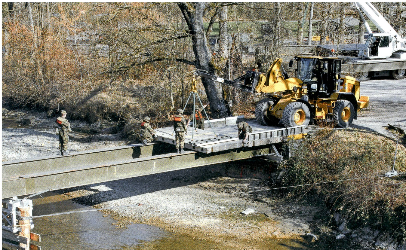
Im Vorfeld ausgeführte Rammarbeiten und die Stahlträgerbrücke waren ganz aus der Nähe zu sehen.

Der vorliegende Text stammt von unserer bewährten Korrespondentin Heidi Bono. Seit langen Jahren berichtet sie für den SCHWEIZER SOLDAT aus der Nordwestschweiz. Die Redaktion freut sich, Heidi Bono mit diesem gelungenen Bildbericht in der Jubiläumsnummer gebührend zu ehren.