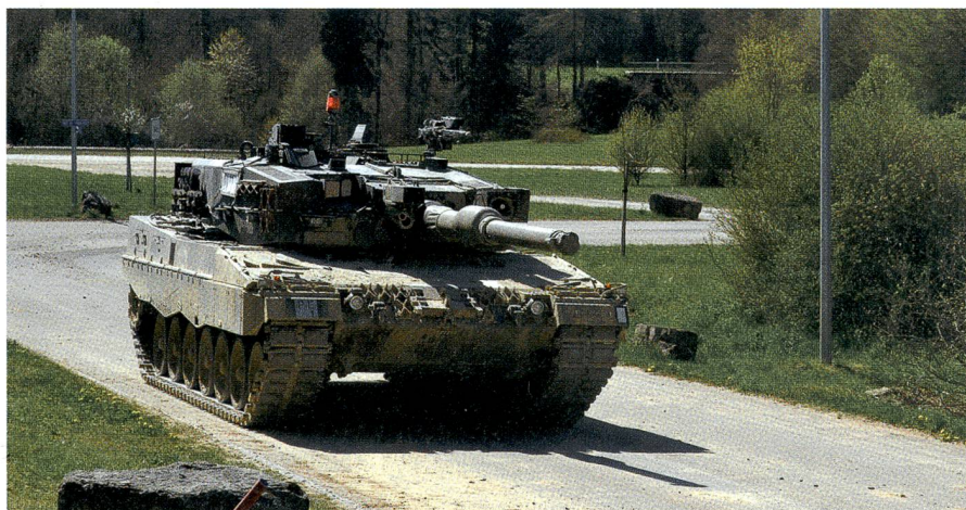
Kampfpanzer Leopard gibt Feuerunterstützung.

Um im HOK bestehen zu können, ist der Panzergrenadier auf sämtliche Unterstützung angewiesen, die ihm zur Verfü-