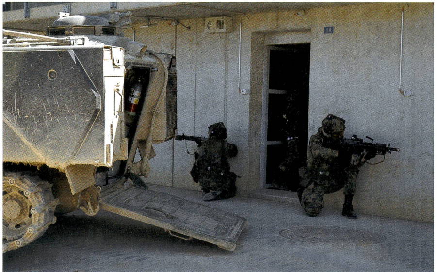
Der Einbruchszug nimmt im Nalé das erste Gebäude.

Für allfällige Bergungseinsätze verfügt die Kompanie über einen Büffel Bergepan-