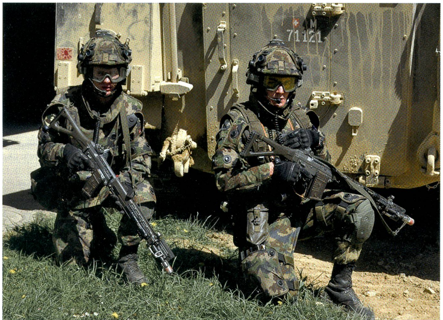
Der Chef der abgesessenen Formation und seine Gefechtsordnanz in Deckung.

So lernen sie intuitiv, eine der Lage angepasste Entscheidung im Sinne der Absicht ihres Chefs zu treffen. Dies ist im HOK besonders wichtig, wie sich später noch zeigen wird. In der zweiten und drit-