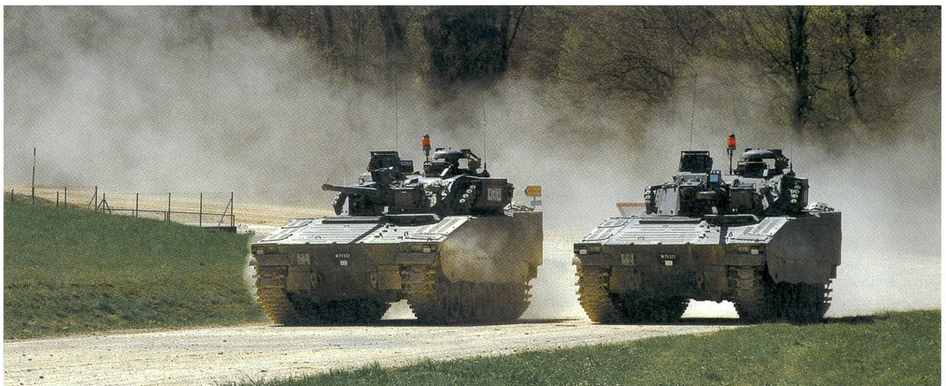
Zwei Schützenpanzer CV-90 des Einbruchszuges rücken vom Rondat zum Nalé vor.