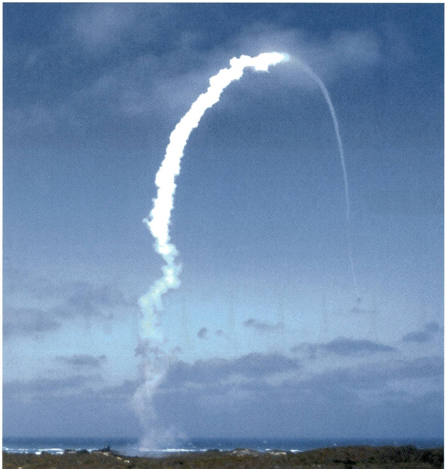
Manchmal machen Fotos Karriere. Dieses Bild ist aus dem SCHWEIZER SOLDAT von der halben Schweizer Presse kopiert worden. Es zeigt die Flugbahn einer IRIS-T SL.

Die grösste Fraktion im Parlament muss ihrem Bundesrat Rückhalt bieten. Die SiK dürfen sich nicht auf die einseitige Pressekampagne verlassen, sondern sollen sich durch die Armee informieren. Denn die SiK müssen hinter dem Projekt stehen. Rasche Entscheide sind geboten, um das Vorhaben doch noch ins RP17 zu bringen.