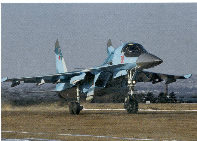
Der Suchoi-34 ist der modernste Russenjet in Syrien.