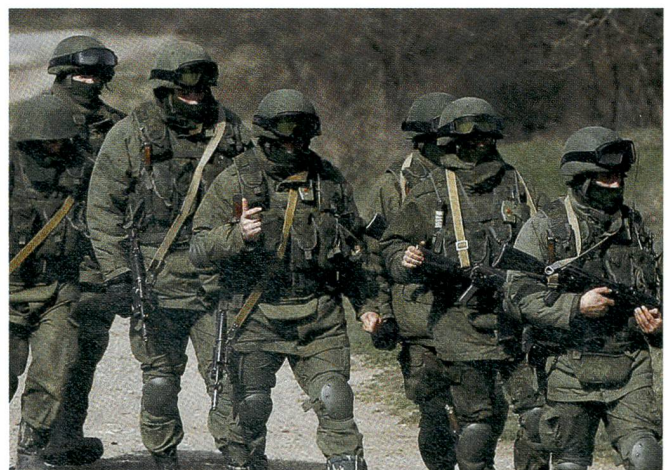
Ohne Hoheitsabzeichen – wie am 1. März 2014 auf der Krim.