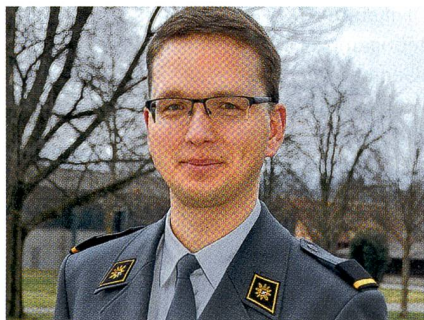
Am Ziel nach langer, harter Arbeit.