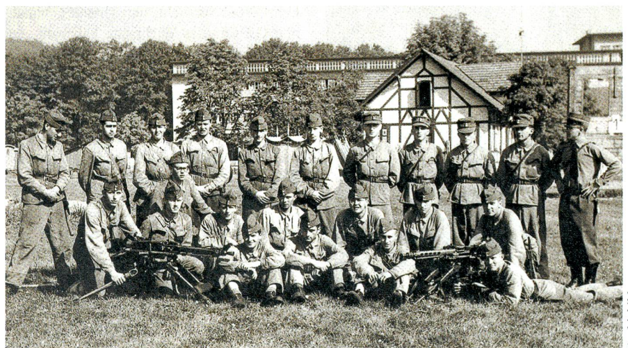
Eine Szene aus längst vergangenen Tagen. Ein offensichtlich intakter Mitrailleuzug von 23 Mann, mit 18 Rekruten im Tenu Blau, vier Gruppenführern mit Uof-Mütze und dem Zugführer mit steifem Hut, Dolch und Stiefeln. Schon damals wurde geholfen.

Am umgekehrten Pol der jährlichen «Rangliste» finden sich wie gewohnt kleine Kantone aus der bäuerlich-gewerblichen Urschweiz und aus den konservativen Ständen der Ostschweiz.