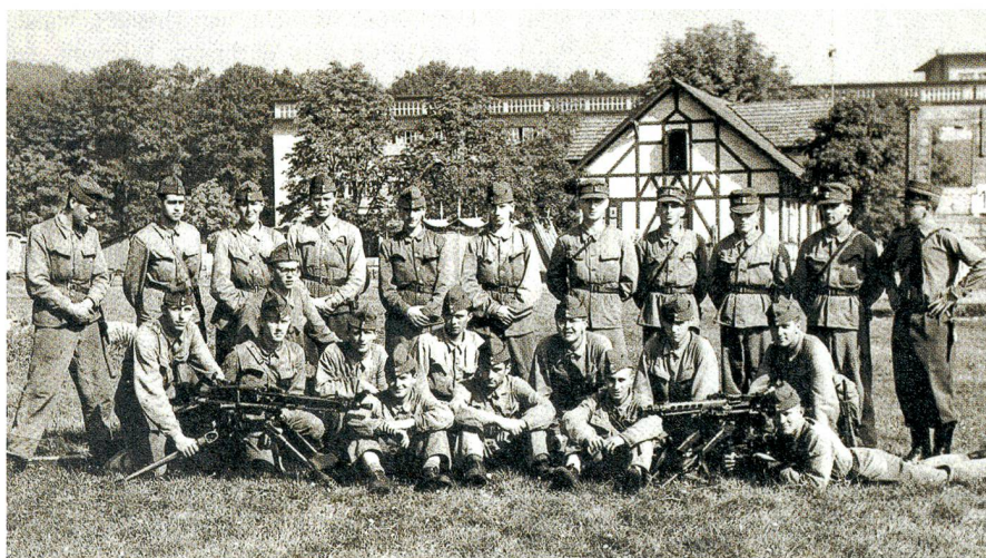
Eine Szene aus längst vergangenen Tagen. Ein offensichtlich intakter Mitrailleuzug von 23 Mann, mit 18 Rekruten im Tenu Blau, vier Gruppenführern mit Uof-Mütze und dem Zugführer mit steifem Hut, Dolch und Stiefeln. Schon damals wurde geholfen.

Am umgekehrten Pol der jährlichen «Rangliste» finden sich wie gewohnt kleine Kantone aus der bäuerlich-gewerblichen Urschweiz und aus den konservativen Ständen der Ostschweiz.