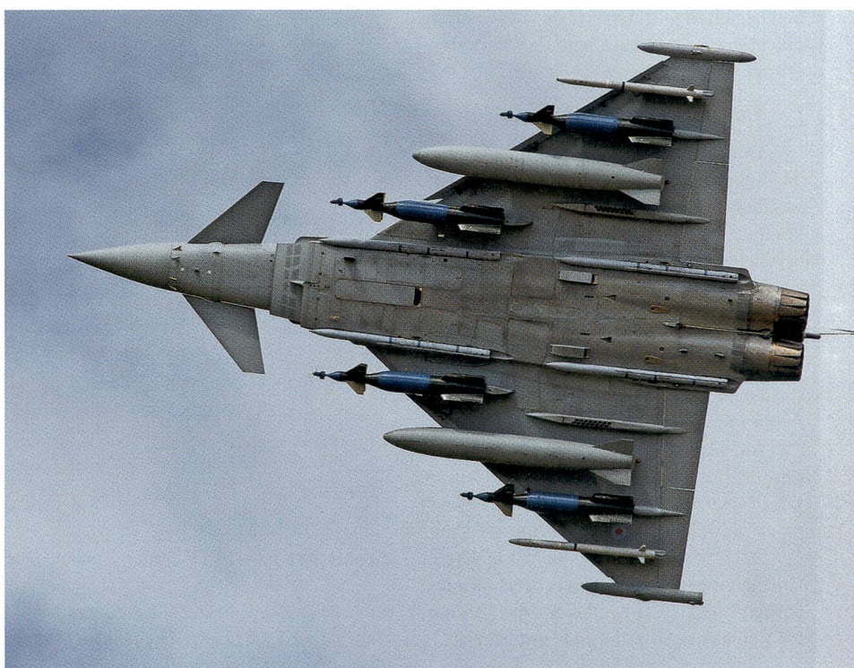
Der Eurofighter ist ein Kampfflugzeug, das von Deutschland, Italien, Spanien und Grossbritannien gemeinsam entwickelt wurde. Nach Auskunft unseres Ressortredaktors Peter Jenni prüft Eurofighter die Teilnahme an der neuen Evaluation der Schweiz.

Ein Blick über unsere Grenzen belegt eindrücklich, dass auch die übrigen europäischen Staaten das Gebot einer starken Luftverteidigung bejahen. Konsequenter-