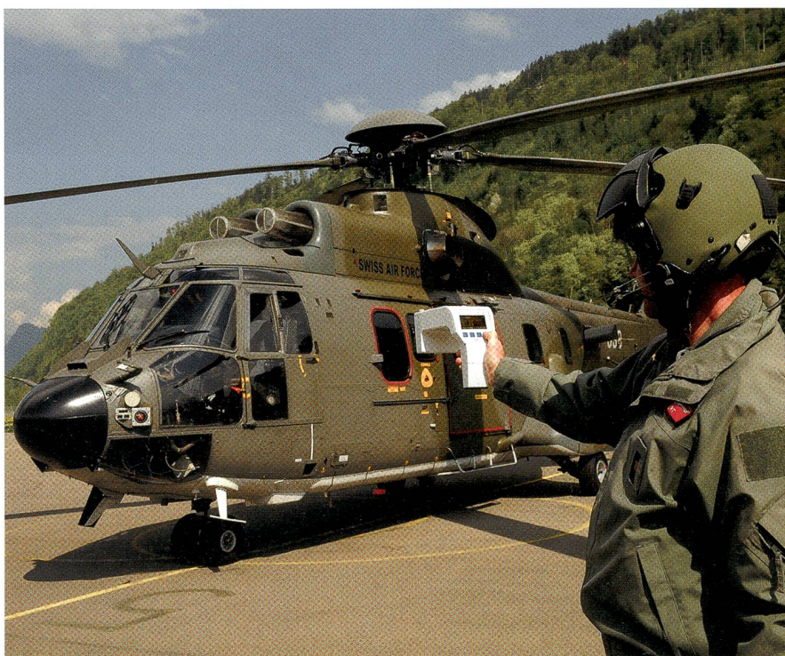
Der Helipilot überprüft mit «missim» vor dem Einsatz die Selbstschutzsysteme.