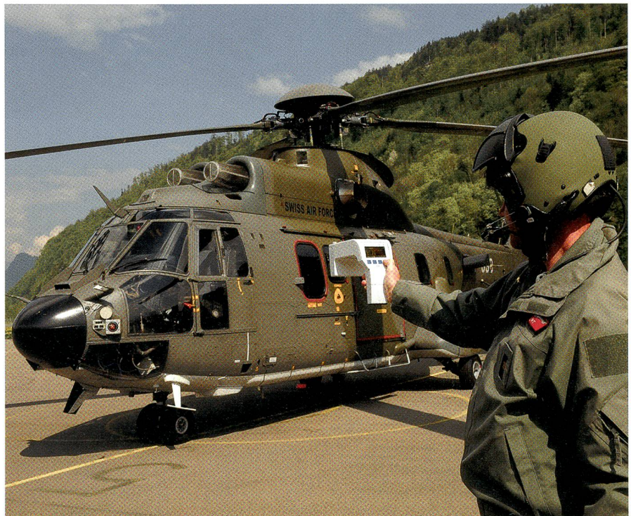
Der Helipilot überprüft mit «missim» vor dem Einsatz die Selbstschutzsysteme.