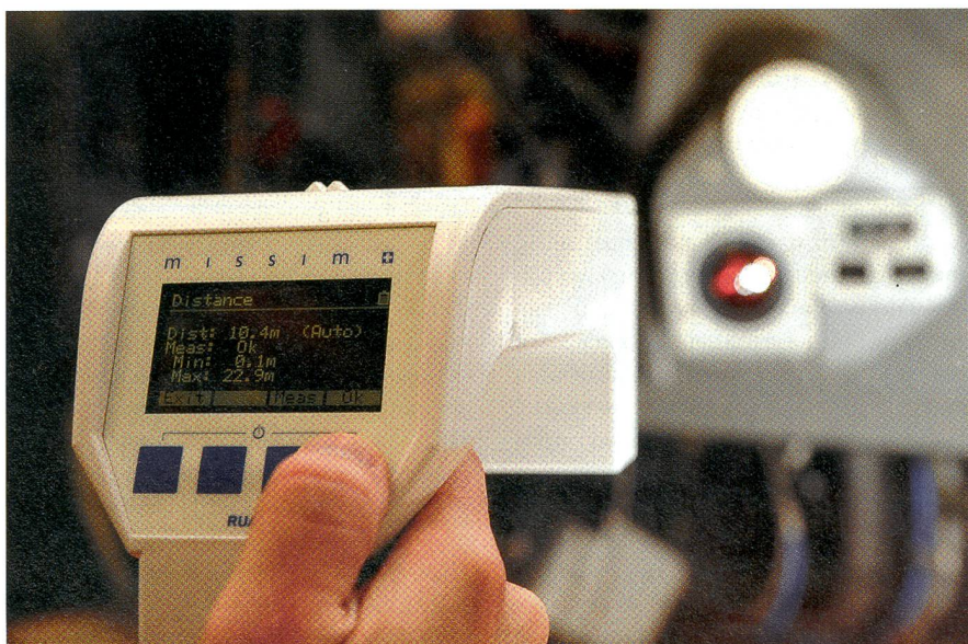
Ruag Aviation verkauft das leicht bedienbare System «missim» nach Deutschland.