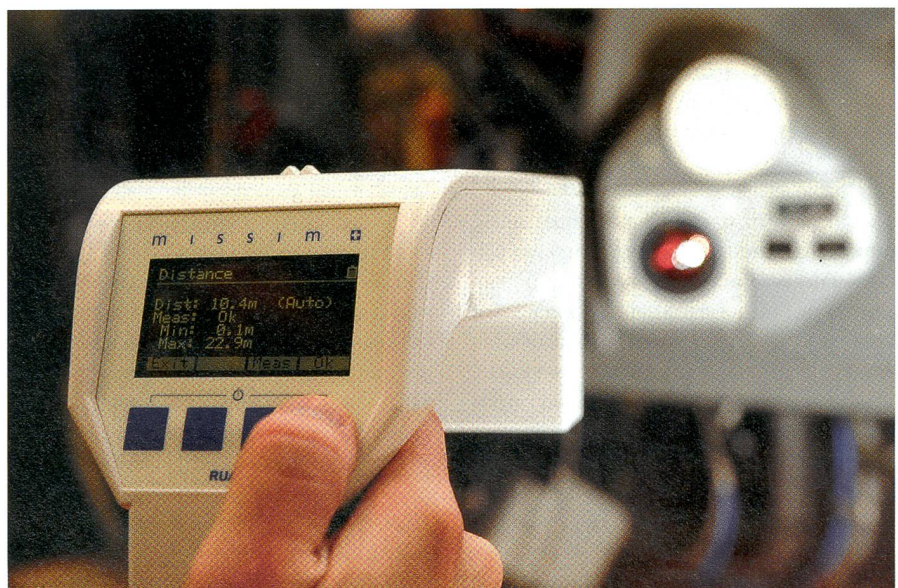
Ruag Aviation verkauft das leicht bedienbare System «missim» nach Deutschland.