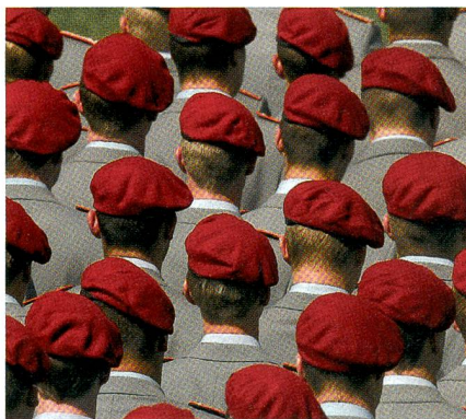
Gewinnung von Nachwuchs gehört zu den vorrangigen Aufgaben der Bundeswehr.

Als Bürger eines Landes, das sich wie die Schweiz mit dem Kauf von Kampfflugzeugen seit der Mirage-Affäre von 1964 derart schwer tut, würde ich mich aber aufs Glatteis