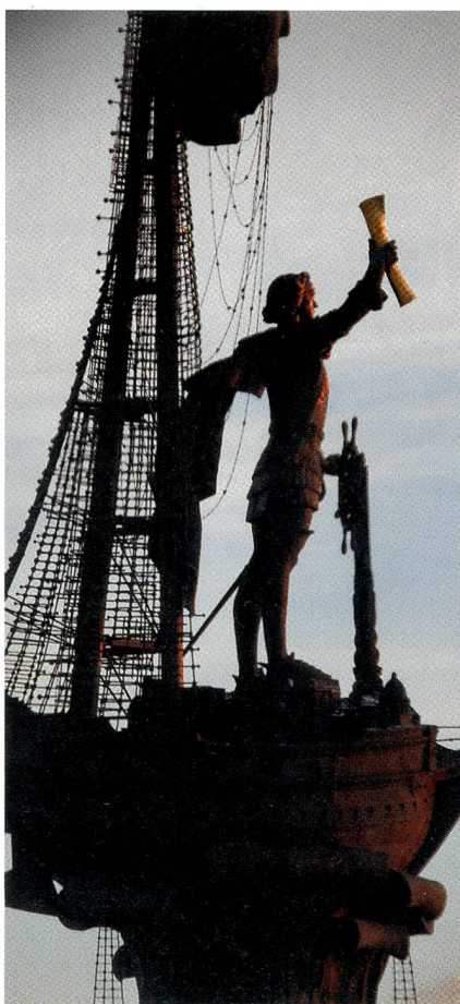
Richtiger Zar: Peter der Grosse. Sein Denkmal auf der Moskwa in Moskau.