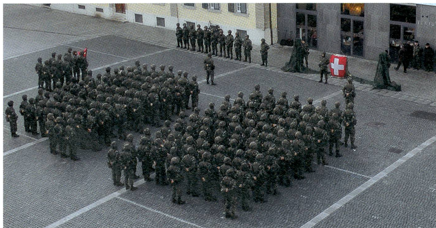
Winterthur: Das FU Bat 11 umfasst den Stab, die HQ Kp 11/1 und die Fhr St Kp 11/2.