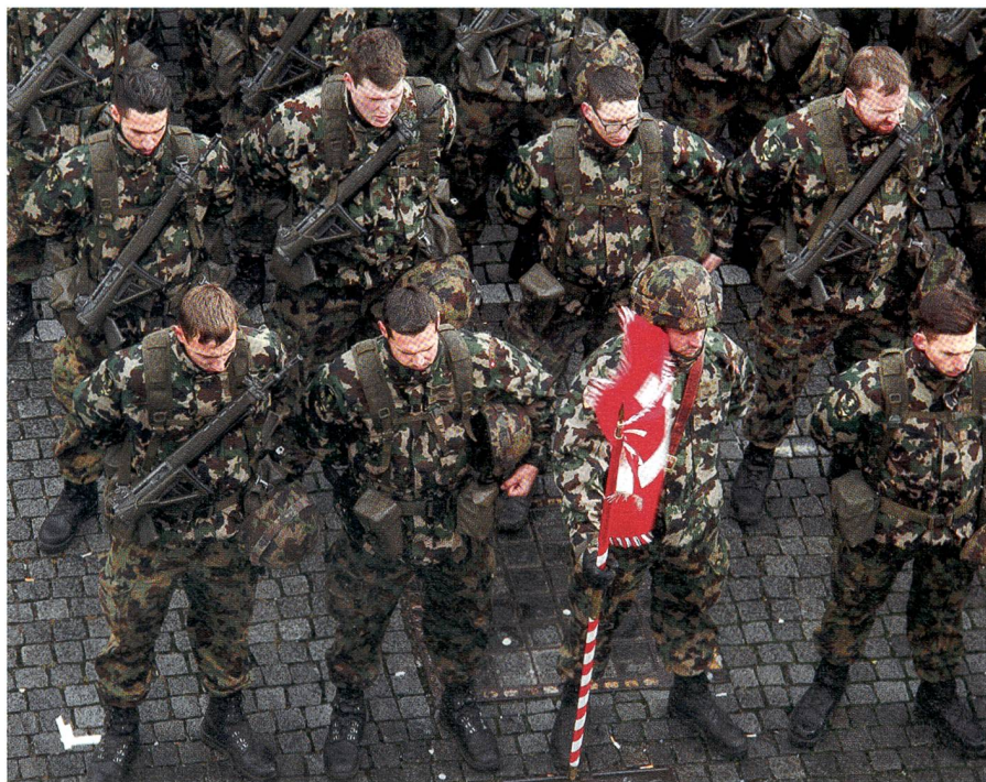
Das Führungsunterstützungs-bataillon 11 ist zur Standartenübernahme angetreten.