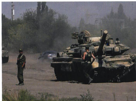
Das neue Bild aus Russland selbst.

In Deutschland spielt mitunter die gute alte soziale Kontrolle. Die Ständige Publikumskonferenz des ZDF reklamierte, worauf der Sender das Bild kleinlaut zu-