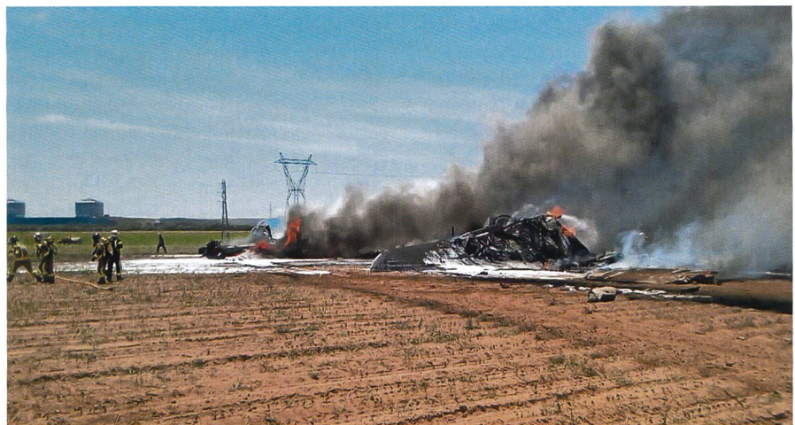
Noch raucht das Wrack des abgestürzten Airbus A400M in der Nähe von Sevilla.

Es waren Flüge mit der Maschine geplant. Der abgestürzte Airbus hätte nach