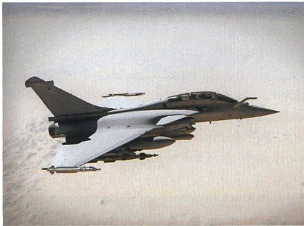
Kampfflugzeug über der Wüste von Katar.

Die Luftstreitkräfte von Katar waren seit Jahren auf der Suche nach einem neuen Kampfflugzeug, am 4. Mai 2015 sollen in Doha die Kaufverträge über 24 Rafale-Kampffjets unterzeichnet werden; bei dieser Zeremonie werden der französische Präsident Hollande und der Emir von Katar da-