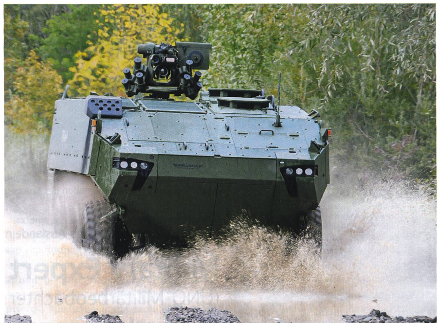
Die dänischen Streitkräfte kaufen mindestens 206 wuchtige, schwere Piranha-5.

Beim Piranha und dem VBCI handelt es sich um 8x8-Radschützenpanzer. Die drei anderen Modelle dagegen sind Ket-