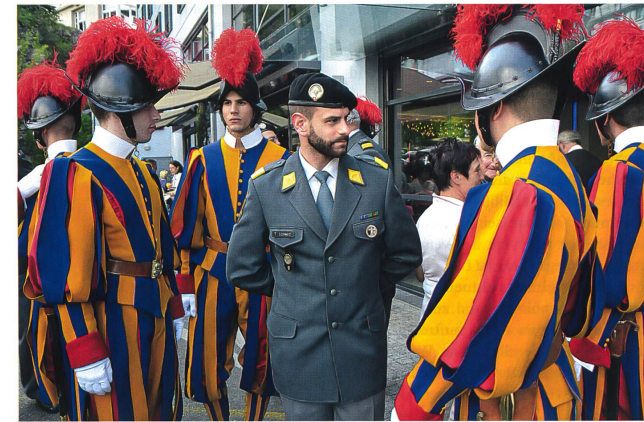
Ein Schweizer in Ausgangsuniform mit Kameraden der Schweizergarde in Galauniform.