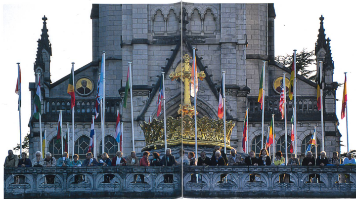
Die Fahnen von 34 Nationen schmückten den Vorplatz der Basilika von Lourdes.