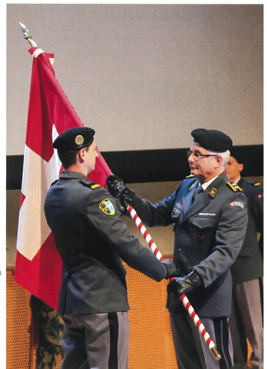
Feierlicher Kommandowechsel am Jahresrapport.