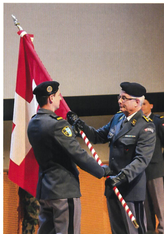
Feierlicher Kommandowechsel am Jahresrapport.