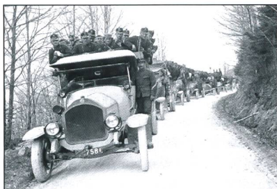
Eröffnung der Sonderausstellung

Weitere Informationen und Eindrücke vom 55. Zwöitägeler erhalten Sie unter: www.2tm.ch . Für weitere Auskünfte steht Ihnen der Marschleiter sehr gerne zur Verfügung: Mügeli Markus; 079 770 96 30, Email: medieninfo@2tm.ch .