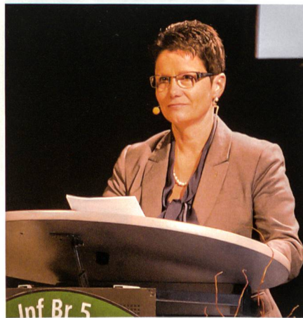
Die Obwaldner Regierungsrätin Maya Büchi bekennt sich zu Sicherheit und Stabilität der Schweiz.