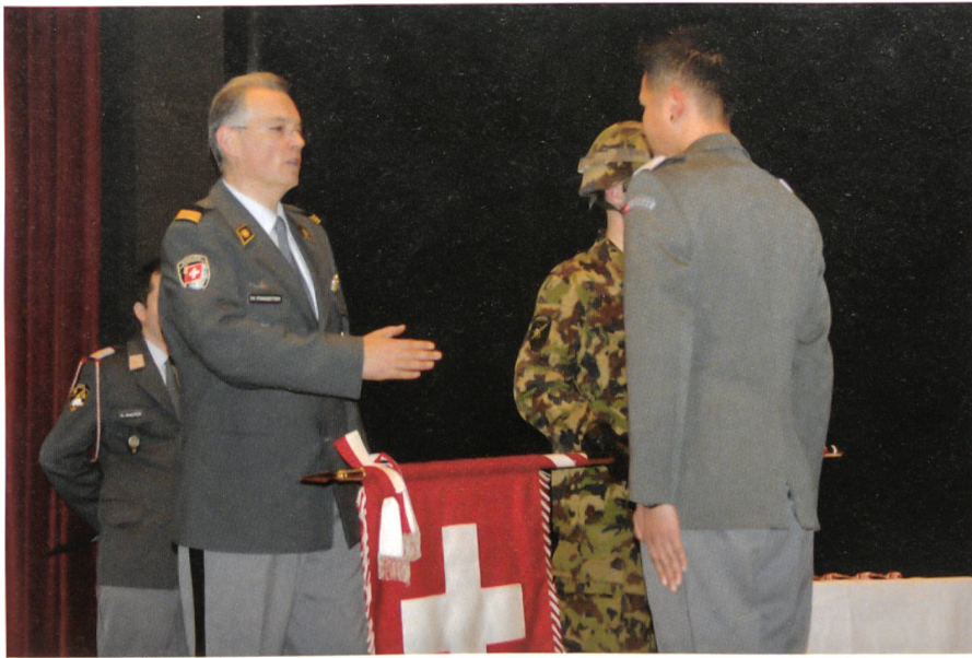
Gemäss alter Regel erfolgt in der Schweizer Armee die Beförderung per Handschlag.