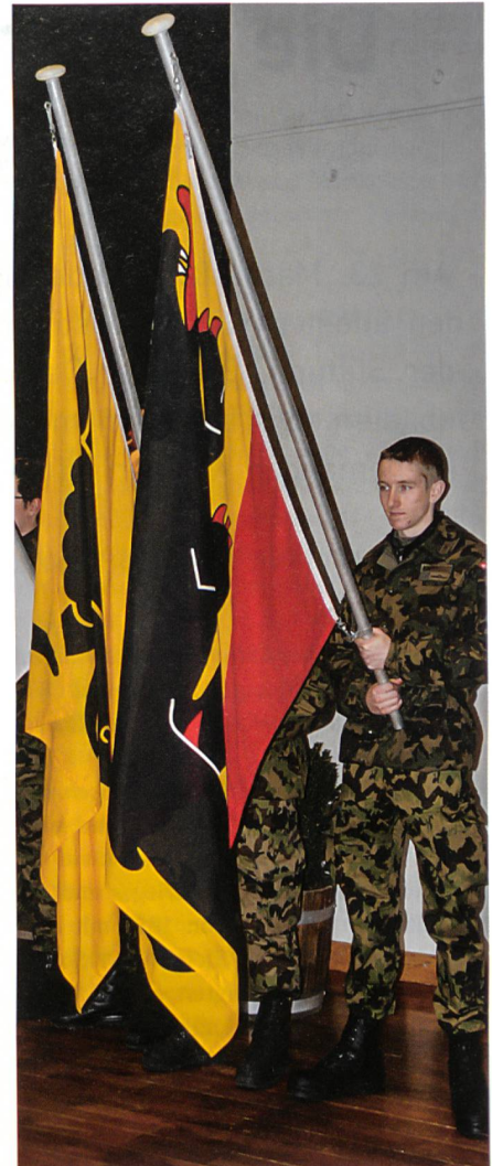
Würdig wurden die Kantonsfahnen präsentiert. Aus dem Kanton Bern stammen zwei der insgesamt 67 Beförderten. Am meisten Brevetierete stellte Zürich mit zehn jungen Schweizern, vor Thurgau mit neun und St. Gallen mit acht, Aargau mit sechs und Appenzell Ausserrhoden und Genf mit je fünf Beförderten.