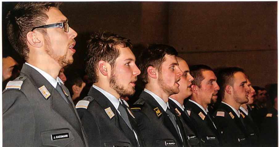
Die Beförderten singen mit allen anderen die Nationalhymne: den Schweizerpsalm.