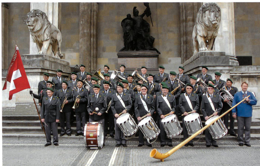
Das Militärspiel Uster am Odeonplatz in München – mit Fahne und Alphorn.