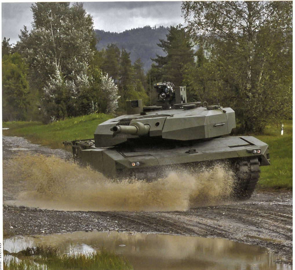
Auf dem Kampfpanzer Leopard ist das sogenannte SidePRO-ATR passive Schutzsystem der RUAG Defence montiert. Es schützt gegen Panzerabwehrwaffen wie RPG-7, gegen KE-Munition (Wuchtgeschosse) und gegen panzerbrechende Munition.