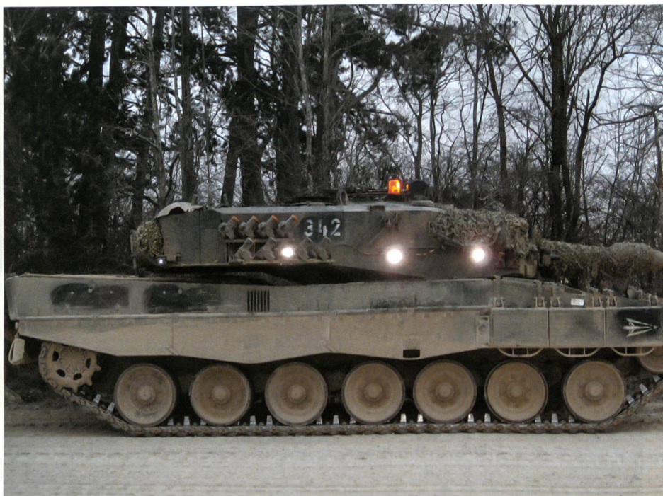
Ein Kampfpanzer Leopard des Pz Bat 12 in Bure. Das Berner Bat gehörte mit dem St. Galler Geb Inf Bat 77 zu den beiden Truppenkörpern, die den Zwei-Wochen-WK austesteten – mit eindeutigen Ergebnis: Beide Bataillone halten an drei Wochen fest.

Nach Einschätzung des Zürcher Nationalrats Hans Fehr würden deutliche Entscheide des Ständerates für eine Stärkung des Kampfauftrages im Nationalrat Spuren