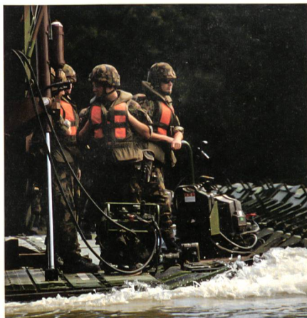
Eine stolze Truppe: Pontoniere aus dem Pont Bat 26 auf der reissenden Aare.

Obwohl es keine fundamentale Sache darstellt, scheint in der medialen Debatte die Frage zu dominieren: zwei oder drei Wochen WK?