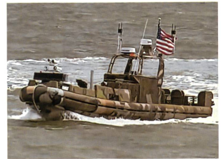
Das Caracas-Steuersystem eignet sich für verschiedenste Bootstypen.

Die U.S. Navy will künftig USVs (Unmanned Surface Vehicles) beschaffen, um ihre Schiffe vor Angriffen zu schützen. Die USVs sollen um grosse Schiffe patrouillieren und diese vor Angriffen mit Speed-Booten schützen. Das Office of Naval Research hat bereits verschiedene Szenarien mit USVs getestet und ein transportables System entwickelt, mit dem ein kleines Boot zu