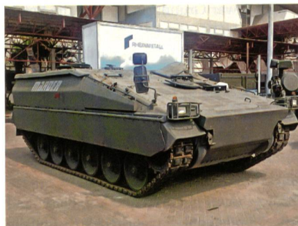
Marder Evolution durch Kampfwertsteigerung «fit for the future».

Auf der «Indo Defence» in Jakarta zeigte Rheinmetall den Schützenpanzer Marder Evolution mit neuen Fähigkeiten durch Kampfwertsteigerung (retrofit). Das vom Konzept her über 40 Jahre alte Fahr-