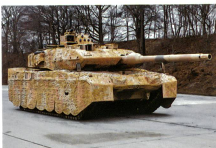
Leopard 2 A7 – die neueste Version des Kampfpanzers für die Bundeswehr.

Der Leopard 2 A7 verfügt nicht nur über optimierten Schutz gegen asymmetrische wie auch konventionelle Bedrohun-