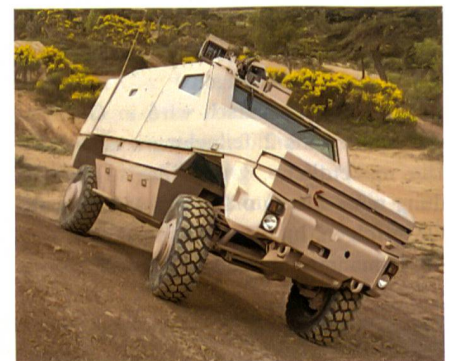
Patrouillenfahrzeug Nexter Aravis für die Streitkräfte von Gabun.

Nexter liefert Gabun zwölf geschützte Aravis-Patrouillenfahrzeuge. Aravis nutzt das gleiche Fahrgestell von Mercedes-Benz wie der Dingo 2. Die Fahrzeuge werden mit ferngesteuerten Waffenstationen ARX20 von