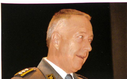
Blattmann: «Wir brauchen die WEA.»