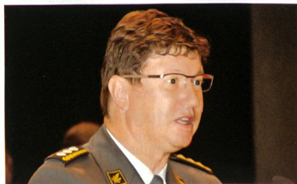
Schellenberg: Dank und Ermunterung.