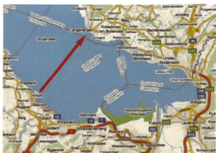
12 km von Arbon nach Langenargen.