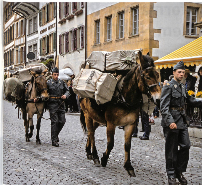
Feldposttransport mit Maultieren – «Comeback» am Umzug in Murten.