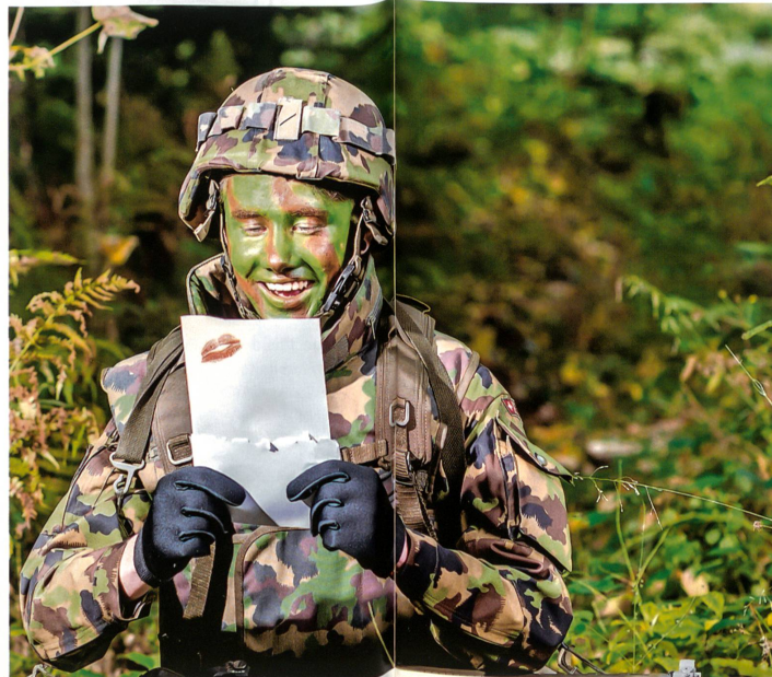
Früher wie heute ein Überbringer von Emotionen: Die Feldpost!