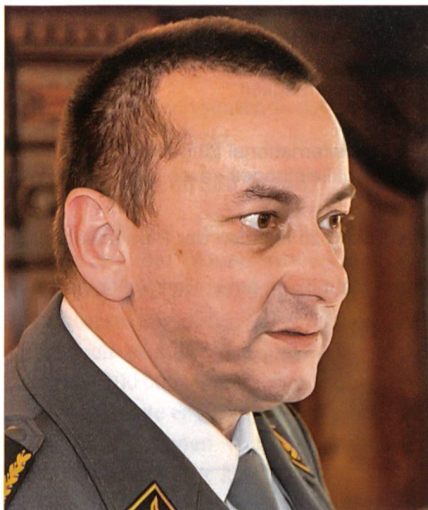
Wellinger: Kampf im überbauten Raum.

Wellinger regt an, die Schiesskommandanten mit den Aufklärern und Scharfschützen zu vereinen und Joint Fire Support and Reconnaissance Teams zu bilden. Dazu