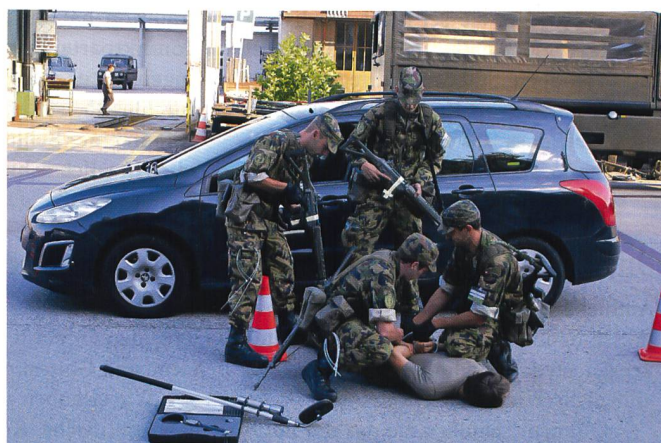
Personenkontrolle, wenn der Fahrer Widerstand leistet.