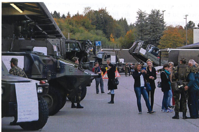
Der Feierabend-Truppenbesuch stiess auf grosses Interesse.