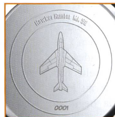
Auf der Rückseite werden die Nummern einzeln graviert