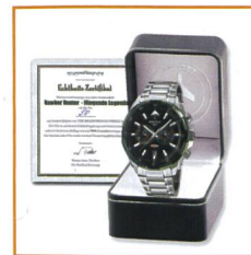
Mit von Hand nummerier- tem Echtheits-Zertifikat