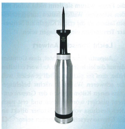
Bei dieser von Rheinmetall entwickelten Panzermunition handelt es sich um die auf der Wolfram-Technologie basierende Wuchtmunition DM63A 1 mit dem Kaliber 120mm.

Es gibt Drohnen, die sind so gross wie ein normaler Jet für den Transport von Passagieren und Waren, daneben fliegen handgrosse Minidrohnen, welche jedermann im Spielwarengeschäft zu günstigen Preisen