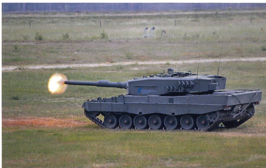
Ein Leopard 2 verschießt mit seiner Glattrohr-Kanone ein Wuchtgeschoss DM63A 1.